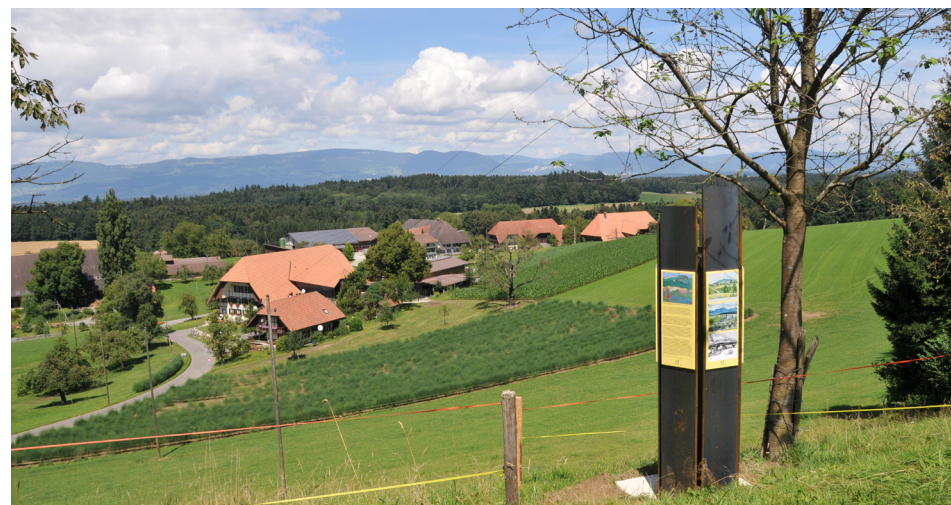
Stele 5 «Amiet-Hesse-Weg» mit Blick auf Spych

Die Mitglieder der Berggesellschaft dachten und handelten genossenschaftlich, und die Mitgliederbeiträge dienten zur Erweiterung der Büchersammlung Oschwand. Die Einladung von Referenten wurde später zum Programm für die Gesellschaft, die heute noch besteht.